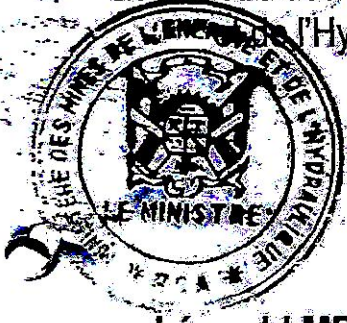
Léopold MBOLI FATRAN

Le Ministre des Mines, de l'Energie et de l'Hydraulique