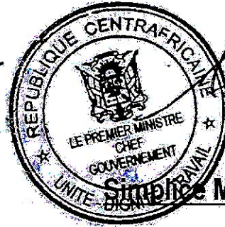
Siméon Mathieu SARANDJI

Le Premier Ministre, Chef du Gouvernement