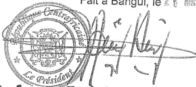
Professeur Faustin Archange TOUADERA